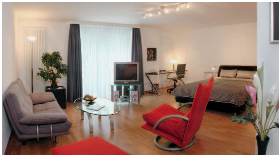
Wohnambiente für anspruchsvolle Gäste: eine Suite im Alceste

Achim und Ruth Kosel betreiben das Alceste: Wohnen wie zu Hause, aber auf höchstem Niveau.