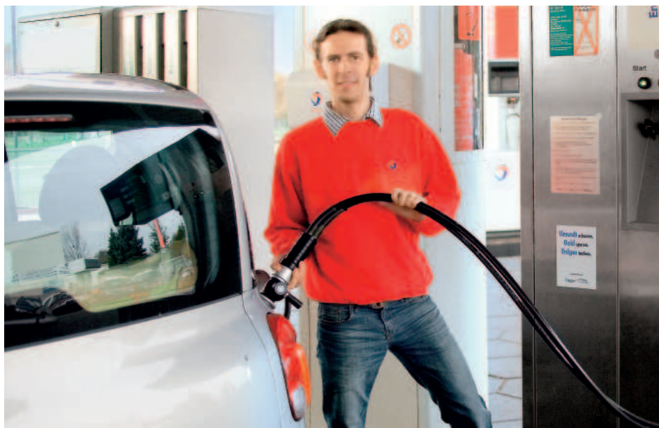
Investitionen der Stadtwerke Dreieich in die Infrastruktur der Region, hier die Erdgaszapfsäule an der Total-Station, Darmstädter Straße