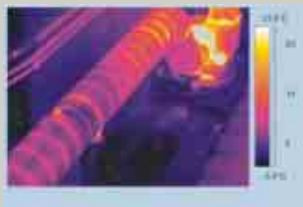
Die Infrarotaufnahme zeigt klar, wo die Wärme verloren geht

In Zeiten steigender Preise sind Energiesparmaßnahmen eine gute Investition. Ein zuverlässiges und wenig aufwändiges Verfahren, mögliche Wärmeverluste im Unternehmen aufzuspüren, ist die Thermografie.