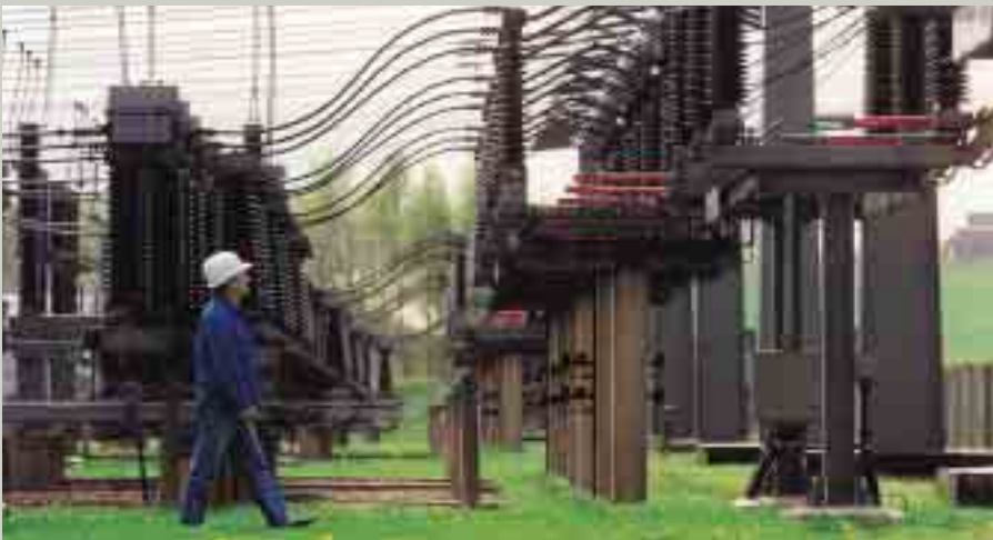
Eine Regulierungsbehörde überwacht die Netzentgelte

Das Energiewirtschaftsgesetz soll den Energiemarkt aufmischen. Fachleute erwarten zunächst höhere Kosten.