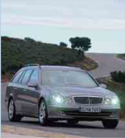
Repräsentative Limousine fährt mit innovativem Kraftstoff: Mercedes E 200 NGT

Boom in der Region: Die Erdgasfahrzeugdichte in der Stadt steigt rapide dank Tankstelle und Förderprogramm.