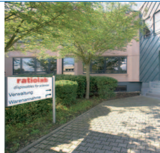
Seit über 30 Jahren erfolgreich am Markt: das Unternehmen Ratiolab mit seinem Sortiment für Labore