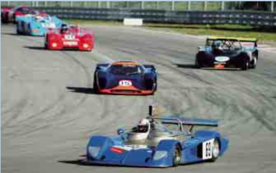
Packende Duelle mit röhrenden Boliden: Orwell-Supersports Cup

Der Orwell-Supersports Cup erfreut sich wachsender Beliebtheit – auch für Sponsoren interessant.