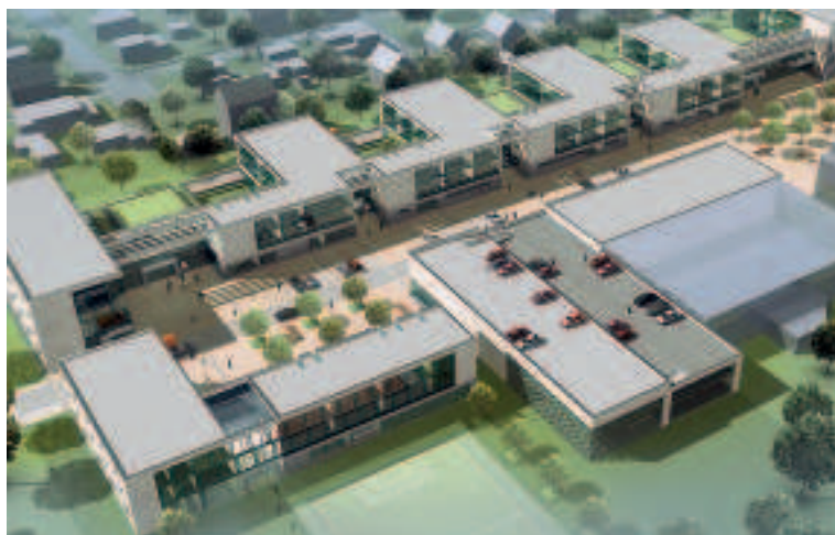
Verschiedene Bildungs- und Sozial-einrichtungen unter einem Dach: Campus Dreieich

Der Landkreis Offenbach realisiert ein gigantisches Bildungsprojekt: „Campus Dreieich – Haus des lebenslangen Lernens“.