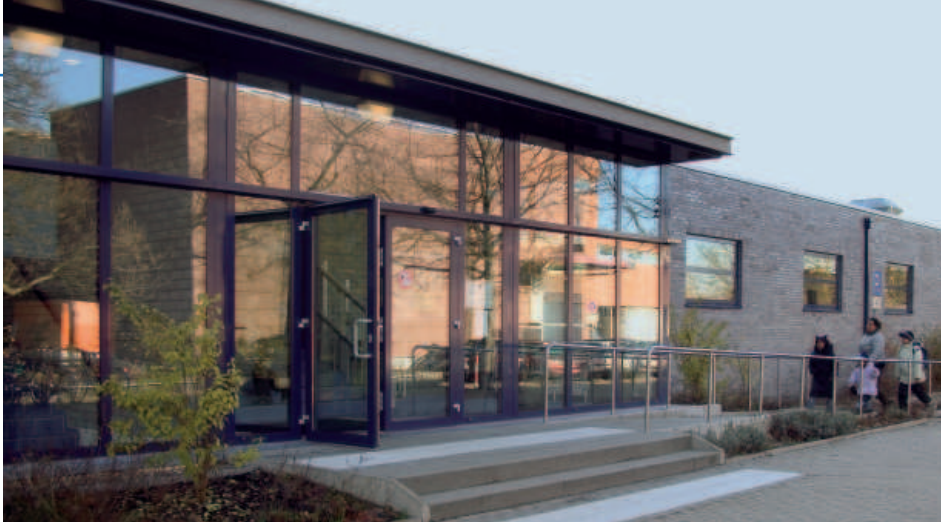
In die Stadt-Holding integriert: Bäderbetriebe Dreieich