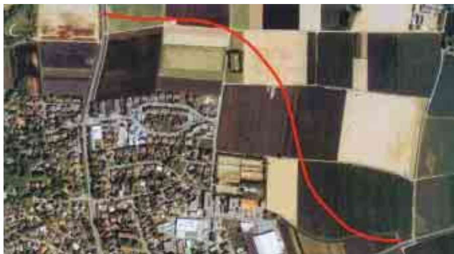
Verkehr in Zukunft: Ortsumfahrung Götzenhain