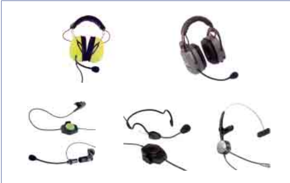
Erfolgreich durch Qualität: Produkte der Imtradex