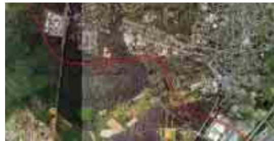
Zwei weitere Objekte: Ortsumfahrung Offenthal (oben) und die Südumgehung (unten)

möglich, da wir – schon vom Gesetz her – Rücksicht auf den Einzelhandel in der Innenstadt nehmen müssen. Die Innenstädte dürfen nicht aussterben, daher können wir dort niemanden ansiedeln, der ähnliche Sortimente wie die Geschäfte in der Innenstadt hat.