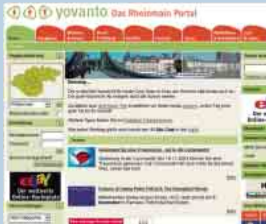
Für Unternehmen vielseitig nutzbar: Startseite des Rheinmain-Portals yovanto

Die Angebotsanfrage ist kostenfrei, für die Abgabe von Angeboten wird ein geringes Entgelt berechnet. Firmen, die noch nicht im Mainindex von yovanto gelistet sind, können den Eintrag