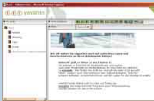
Kinderleicht: Administration der eigenen Homepage mit dem Web-Kreateur von yovanto

ihrer Daten online veranlassen. Die Aufnahme der Grunddaten ist kostenfrei.