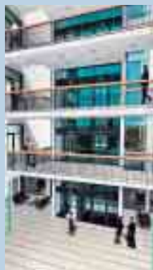
Großzügige Gestaltung in den Innenräumen

Otto-Hahn-Str. 1 63303 Dreieich Telefon: (0 61 03) 5 03 50 Telefax: (0 61 03) 50 35 35