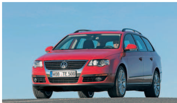
Flotter Dienstwagen: Passat 1,4 TSI mit Turbo-Erdgasmotor

Aber Erdgasautos stehen schon heute steuerlich gut da. Nach der neuen gesetzlichen Regelung wird die Kraftfahrzeugsteuer nicht mehr nur nach dem Hubraum eines Fahrzeuges berechnet, sondern auch nach der CO 2 -Emission. Jedes Gramm CO 2 , das die Freigrenze von 120 Gramm überschreitet, kostet 2 Euro Steuer im Jahr. Ein erdgasbetriebener VW Passat 1.4 TSI EcoFuel, der nur 119 Gramm pro Kilometer ausstößt, bleibt unterhalb der Freigrenze, der CO 2 -Anteil ist damit kostenfrei.